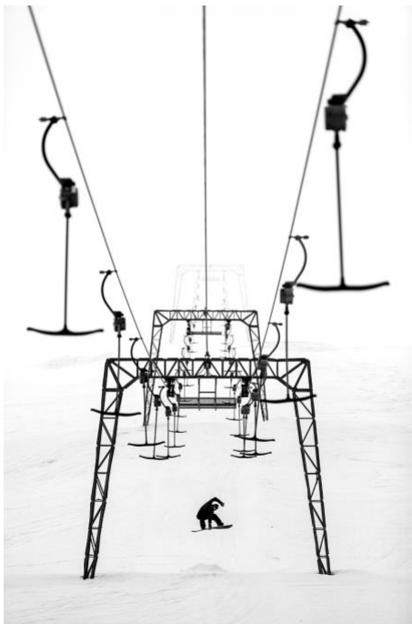
Lorenz Holder 2010_DGH1_Holder_1_200dpi.jpg