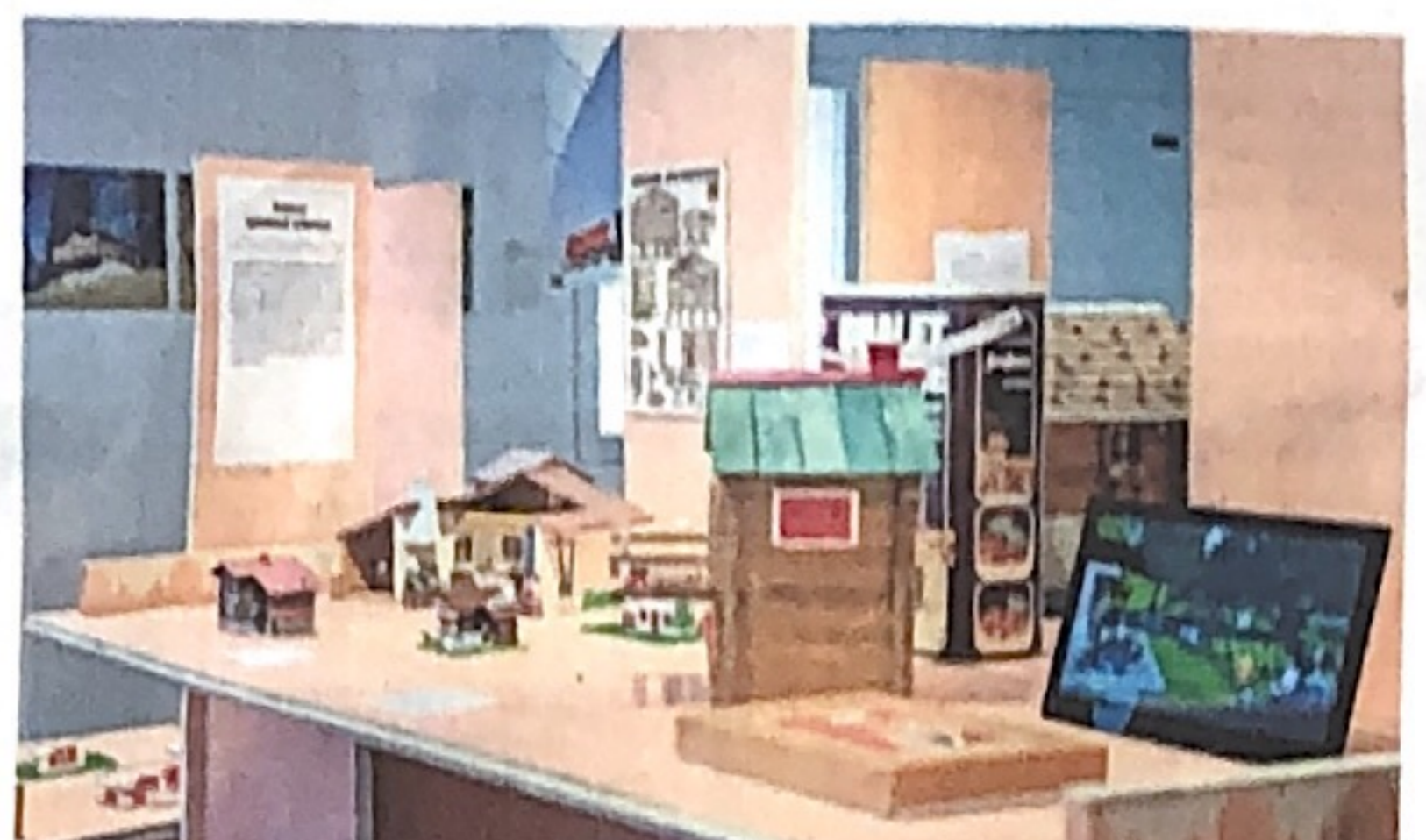
Im Wandel der Zeit: An der Ausstellung «Mythos Chalet – Sehnsucht, Kitsch und Baukultur» im Gelben Haus in Flims wird die Geschichte des Chalets gezeigt.

Auf der ersten Etage sind neben den Uhren auch Souvenirs aus der Gegenwart und aus der Vergangenheit zu sehen. Auf der zweiten Etage, beim Thema Sehnsucht, geht es darum, woher die Chalets stammen und wie alles angefangen hat. Während die erste Etage rosarot gehalten ist, sind die Exponate in der zweiten Etage an schlichten hellbraunen Holzwänden montiert. Aus Lautsprechern ertönt das Geräusch von Kühen mit Kuhglocken und Vogelgezwitscher. Ein Gefühl von Heimat und