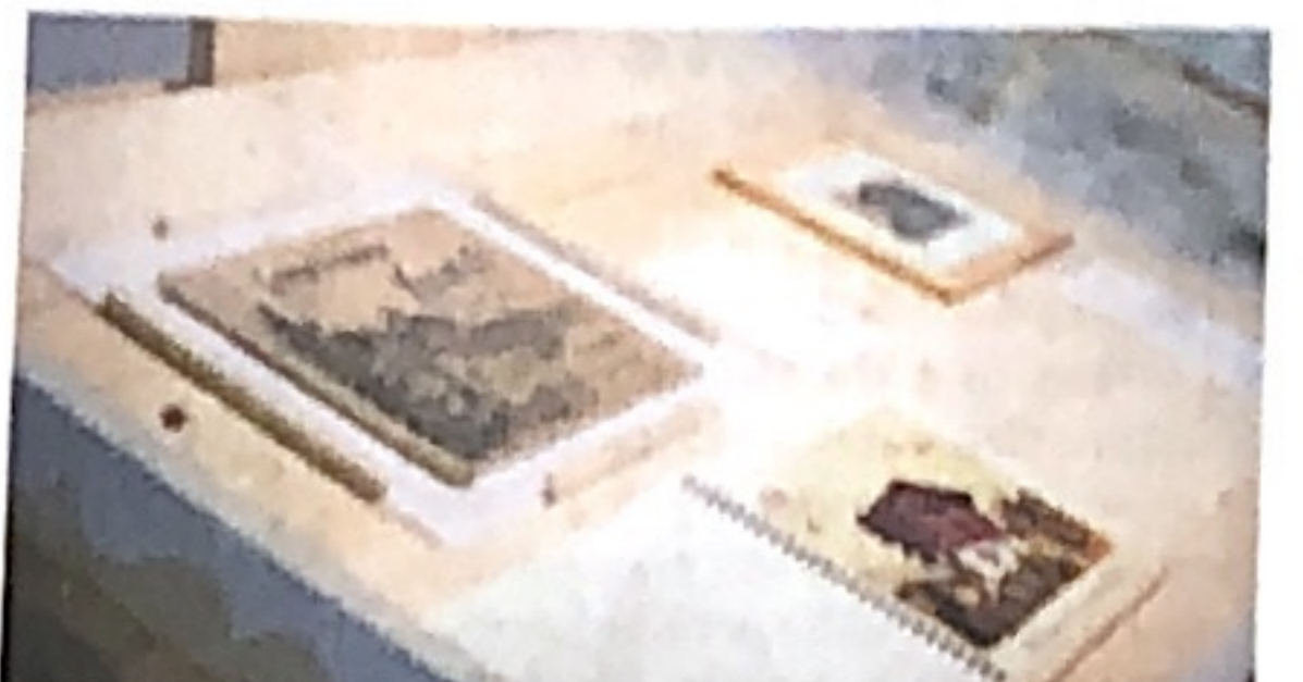
Zum Bestellen: In der zweiten Etage können alte Kataloge der Chaletfabriken durchgeblättert werden.

«Das Chalet ist auf der einen Seite ein Bauwerk, auf der anderen Seite hängt eine Geschichte daran.»