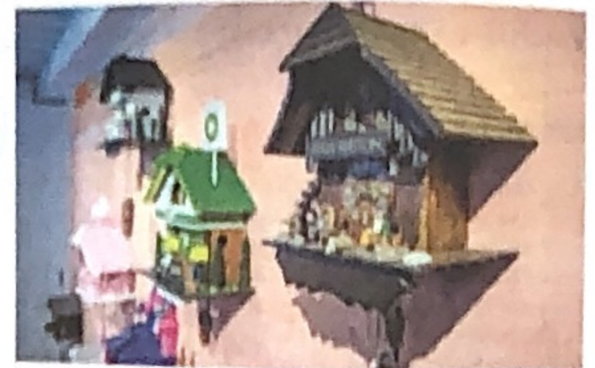
Kitschig: Die Kuckucksuhren wurden vom finnischen Künstler Jani Leinonen kreiert.